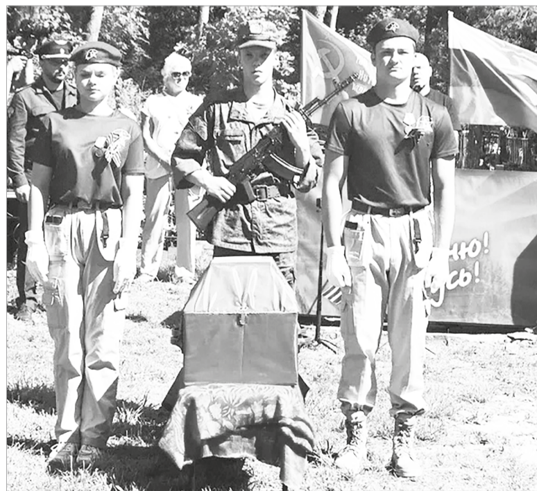
Церемония захоронения в д. Пономарёво