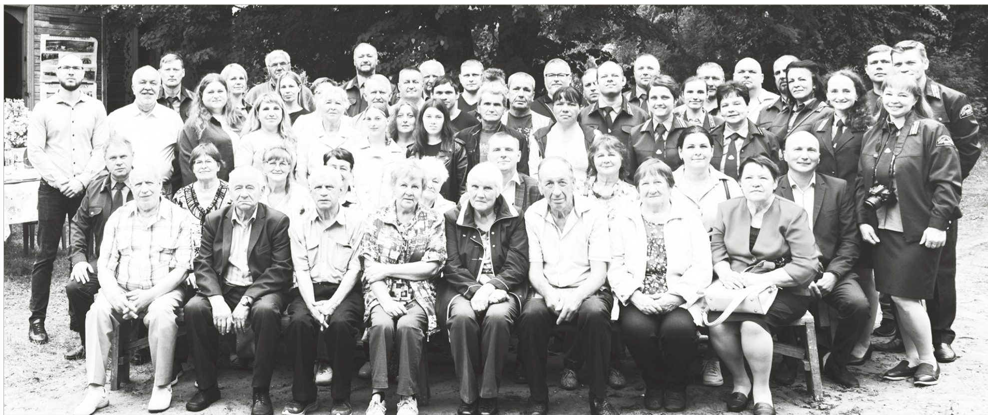
Коллектив лесничества и ветераны лесного хозяйства