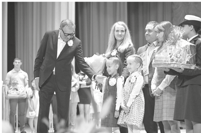
Церемония присвоения звания «Почётная семья Ленинградской области»

ПОЧЁТНЫЕ НАГРАДЫ «СЛАВА МАТЕРИ» И «ОТЦОВСКАЯ ДОБЛЕСТЬ»