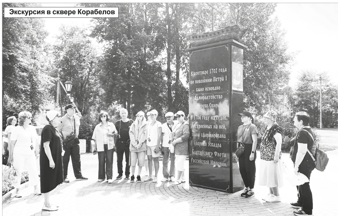
Экскурсия в сквере Корабелов

Группы туристов стоят у одного из памятников в сквере Корабелов. Такому явлению, как теплоходные туристы в Лодейном Поле, никто не удивляется. Они были и в советские времена, были в начале двухтысячных, есть они и сейчас. Июль – пик туристического сезона. И самый востребованный маршрут: ЛОДЕЙНОЕ ПОЛЕ – МУЗЕЙ – СКВЕР КОРАБЕЛОВ – АЛЛЕЯ ГЕРОЕВ. За годы многое изменилось в маленьком городе на Свири. И те туристы, которые приезжали сюда лет 20 назад, не узнают Лодейное Поле, отмечая очень заметные изменения в его облике. В любое время развития города главными проводниками в историческую тематику для гостей были и есть экскурсоводы. Настоящие «ходячие энциклопедии», как часто называют их некоторые путешественники. Благодаря экскурсоводам туристы не просто получают информацию об истории города, а принимают её, пронеся через своё сердце.