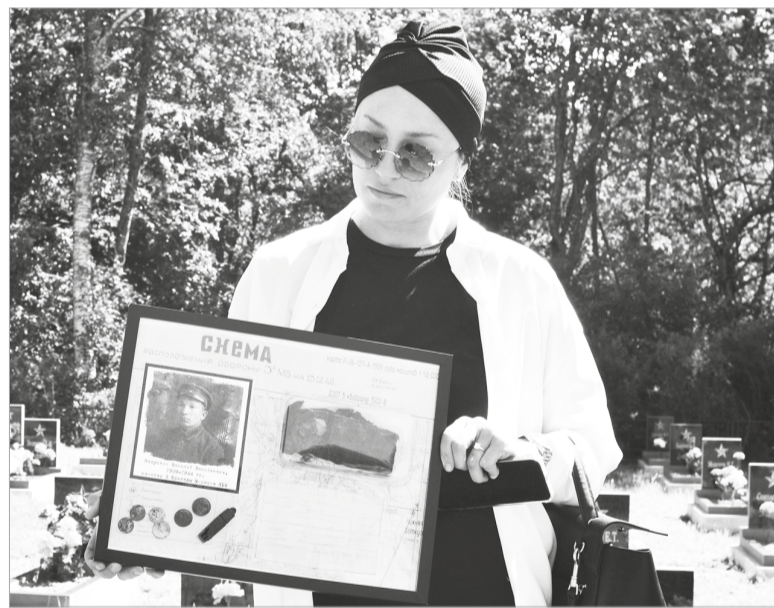
Поисковики передали вещи погибшего бойца его правнучке