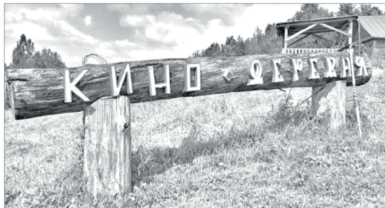
Фото разных лет сделаны во время съёмки в кинодеревне у д. Люговичи