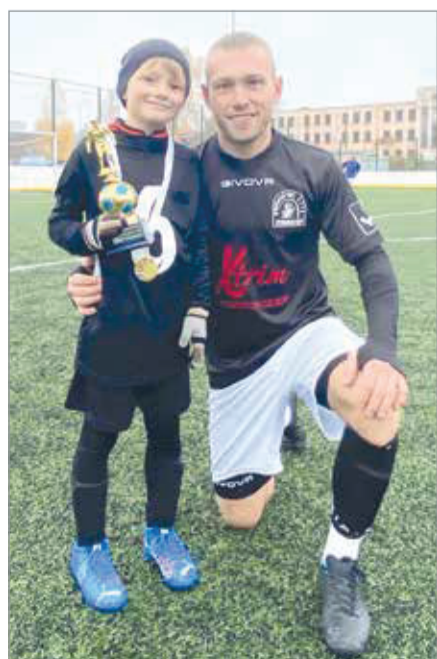
Папа и сын Мироновы