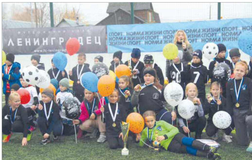
Итоги подведены, победители награждены