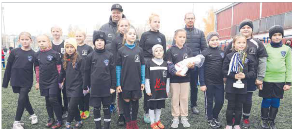
С победой, юные «славаторки»!

Светлана МИХАЙЛОВА