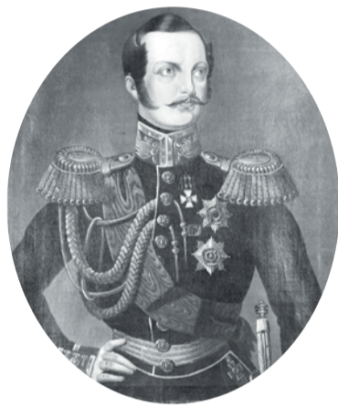
Император Александр II