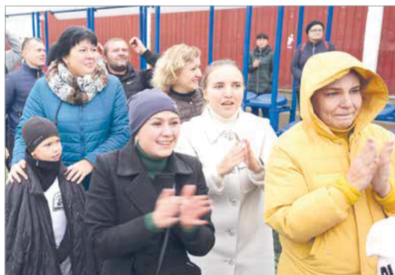
Поддержка мам-болельщиц очень нужна