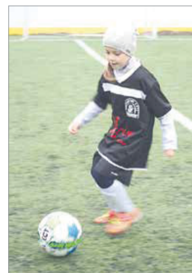
Заветный мяч – послать в ворота!