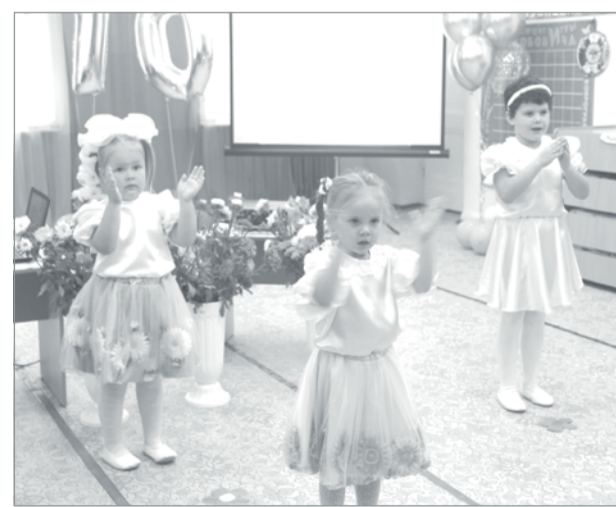
Творческий подарок от малышей