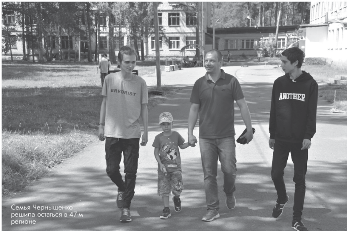
Семья Чернышенко решила остаться в 47-м регионе

– ПВР в Тихвинском районе – образец взаимодействия го-