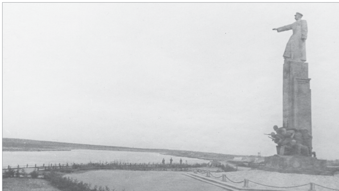
Демонтаж фигуры И.В.Сталина с монумента был произведен в 1956 году

После XX съезда КПСС “от Москвы до самых до окраин” прокатилась “волна” сноса памятников и бюстов Генералиссимусу