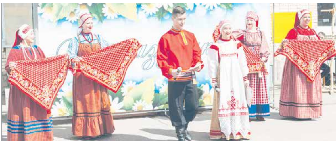
Гостей приветствуют Пётр и Феврония Муромские и студия «Берегиня»