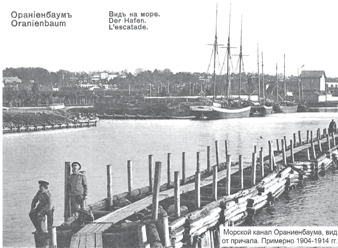
Морской канал Ораниенбаума, вид от причала. Примерно 1904-1914 г.

рекомендовалось исключить, сосредоточив при этом внимание на простейших типах свайных конструкций, деревянных эстакадах и ограждениях. В качестве огнестойких сооружений предполагалось использовать набережные из надводной каменной стенки на свайном основании, частью деревянным, частью железобетонном. Поскольку порт предстояло строить на