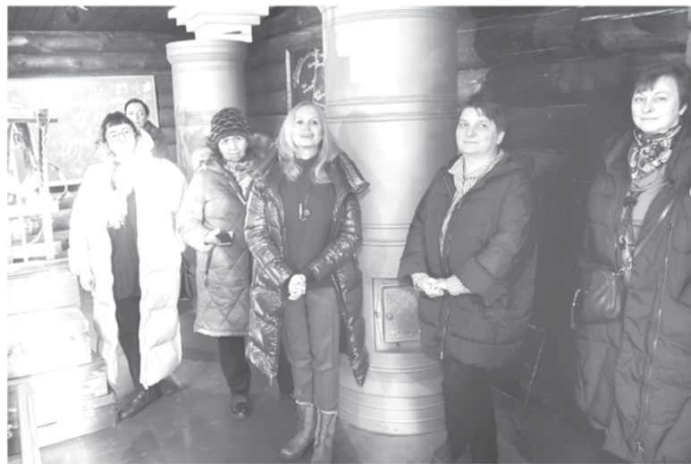
Экскурсии по новой экспозиции распланы на месяц вперёд