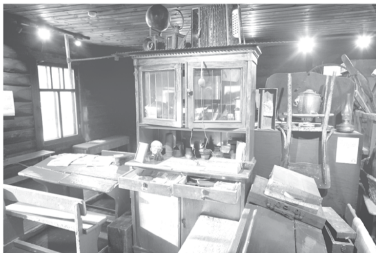
Школьные парты, мебель и старый самовар – все эти вещи из 40-х годов хранят свою память о событиях военных лет

ОТКРЫТЫЙ ПОСЛЕ РЕКОНСТРУКЦИИ МУЗЕЙ «АСТРАЧА, 1941» ЖДЁТ ГОСТЕЙ НА НОВУЮ ЭКСПОЗИЦИЮ О ВЕЛИКОЙ ОТЕЧЕСТВЕННОЙ ВОЙНЕ