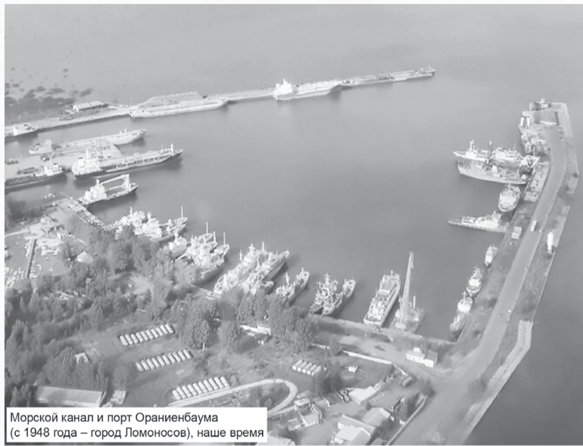
Морской канал и порт Ораниенбаума (с 1948 года – город Ломоносов), наше время

обратно. 28 октября 1934 года построенная гавань вошла в состав Главного военного порта Морских сил Балтийского моря как Ораниенбаумское отделение. На него возлагалось обеспечение Ораниенбаумского авиагарнизона, приём и отправка всех грузов МСБМ, проходящих через Ораниенбаумский железнодорожный узел; расквартирование воинских частей и комсостава; наблюдение за ходом нового казарменного и складского строительства; обеспечение всех мероприятий по внутренней и противопожарной охране как порта, так и базирующихся на Ораниенбауме частей и кораблей МСБМ. Командир Ораниенбаумского отделения подчинялся непосредственно командиру ГВП, а в гарнизонном отношении – начальнику