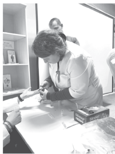
ПУТИ ЗАРАЖЕНИЯ ВИЧ (ЛЕНИНГРАДСКАЯ ОБЛАСТЬ, 2022 ГОД)

– Чем раньше человек узнает о своей болезни, тем выше шанс сохранить здоровье и жизнь. К нам недавно обратился 37-летний мужчина, который понял, что мог заразиться вирусом от своей девушки. Пациент сдал тест и получил положительный результат. Сейчас его жизни ничто не угрожает, потому что он оперативно начал