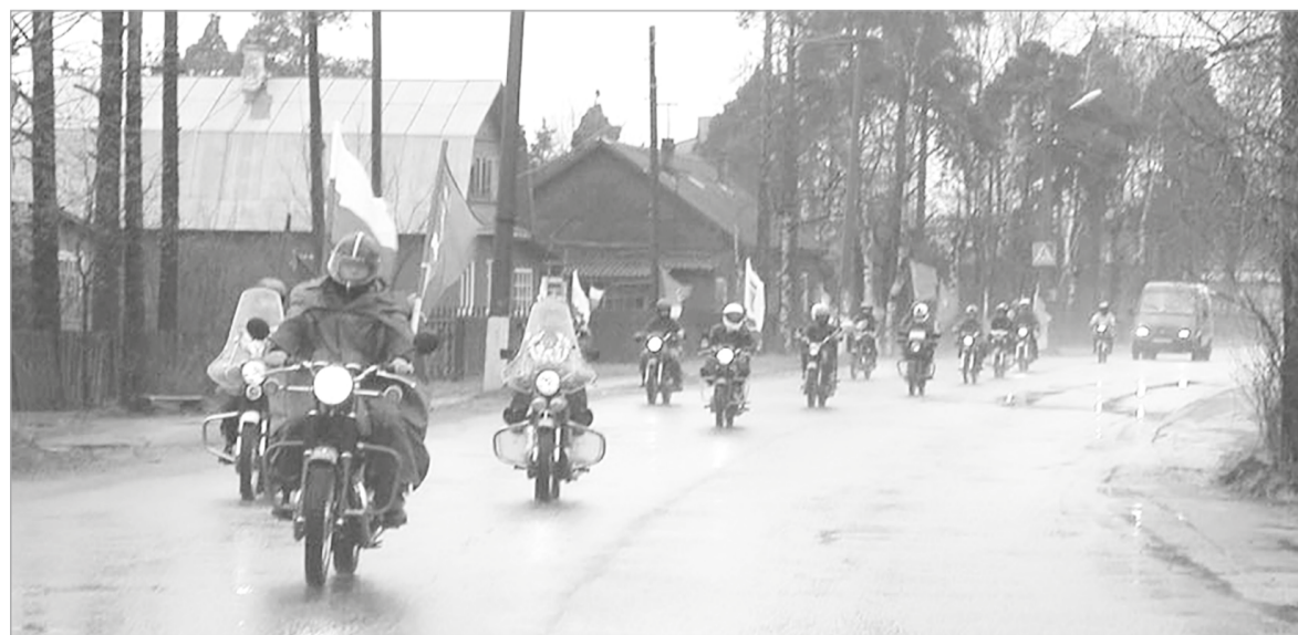
Эскорт мотоциклистов под руководством В.Т.Федоровского