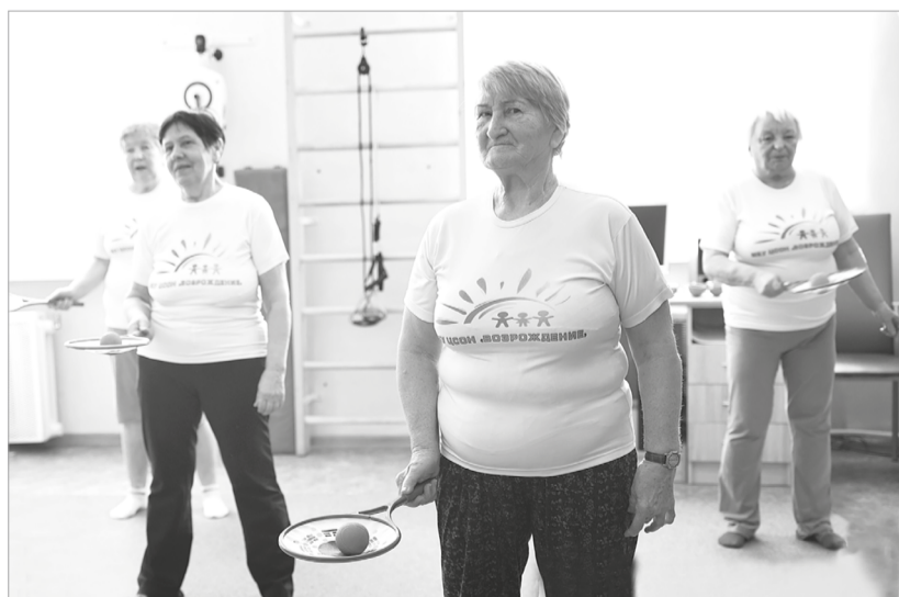
Физические упражнения полезны в любом возрасте