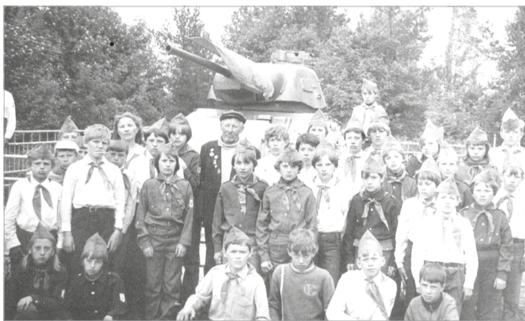
На высоте Самбатукса

И вдруг неожиданно для всех прозвучала команда командира слёта, участника группы ложного десанта на р. Свири