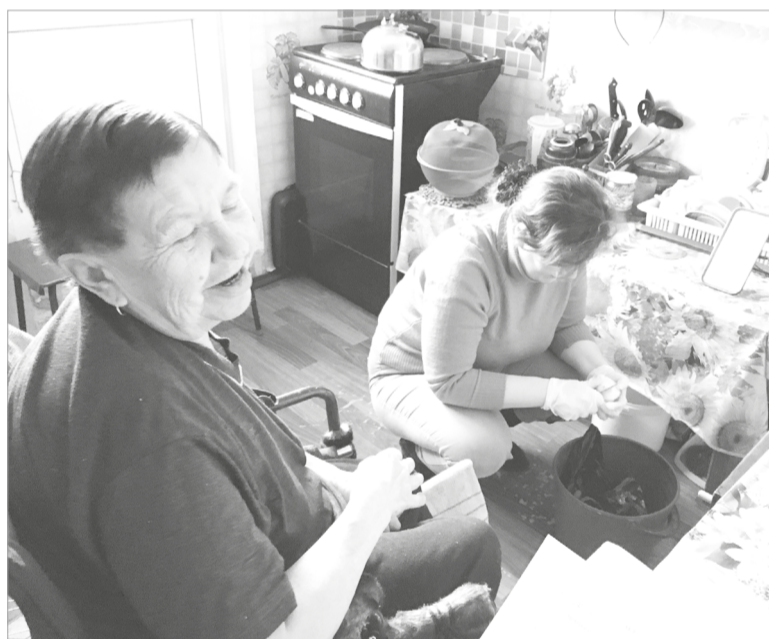
Социальная помощь на дому

Социальная работа, как вид профессиональной деятельности, требует от любого специалиста особых знаний, умений и навыков, а также личностных качеств, без которых осуществление этой помощи невозможно. Практически все работники Центра имеют специальное образование и соответствующую подготов-