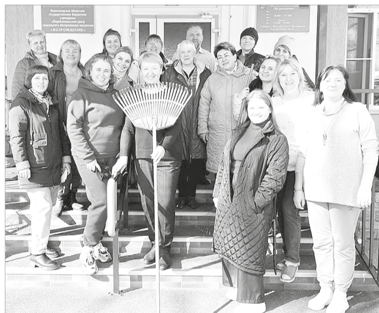
Всем коллективом – на субботник!