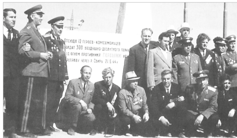
Герои-свирцы у первого памятного знака на берегу Свири

Рассвет 21 июня 1989 года был такой же ясный и солнечный, как и в 1944 году. Утром ветераны и участники слета на паромных установках в сопровождении катеров и моторных лодок, расцвеченных флагами пятнадцати союзных республик, опустили венки в волны Свири и совершили пешеходный переход до озера Светлое.