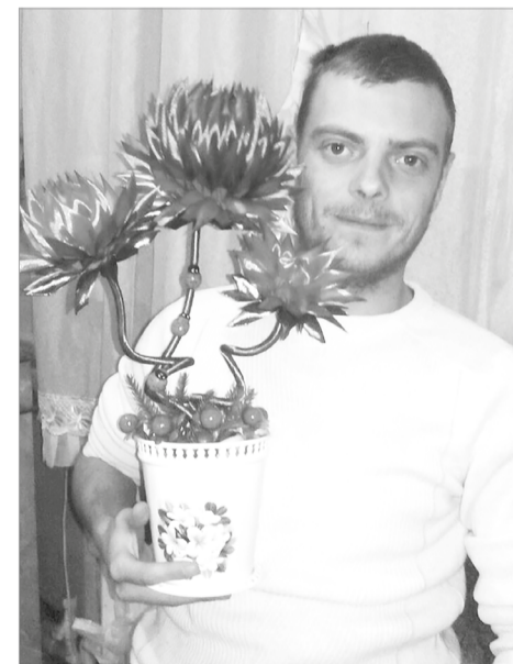
Делал красивые топиарии из атласных лент