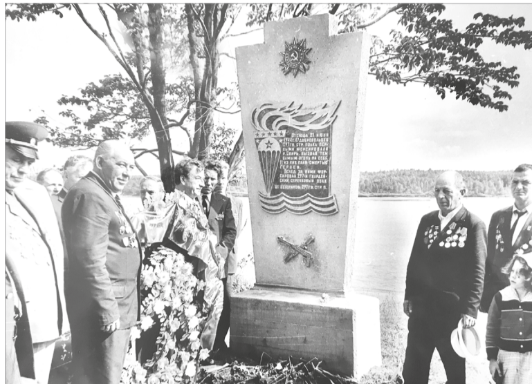
Отсюда добровольцы первыми форсировали Свирь