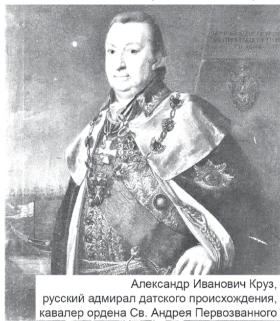
Александр Иванович Круз, русский адмирал датского происхождения, кавалер ордена Св. Андрея Первозванного

Роченсальмская победа позволила русским войскам в Финляндии начать наступление и высадить пятитысячный морской десант в устье реки Кюммене в тылу противника. Однако из-за нерешительности и медлительности командующего войсками В. П. Мусина-Пушкина благоприятная обстановка не была использована. Опасаясь окружения, шведские войска отступили