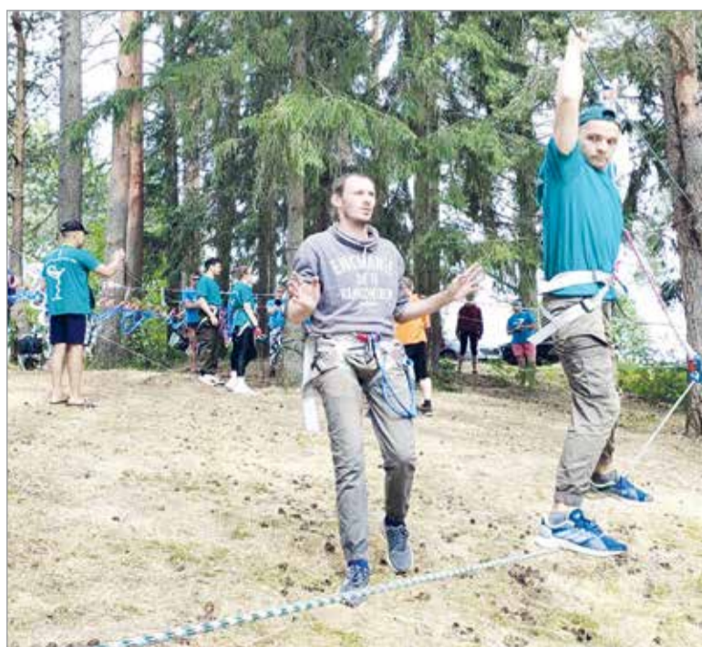
Испытания на туристской полосе препятствий