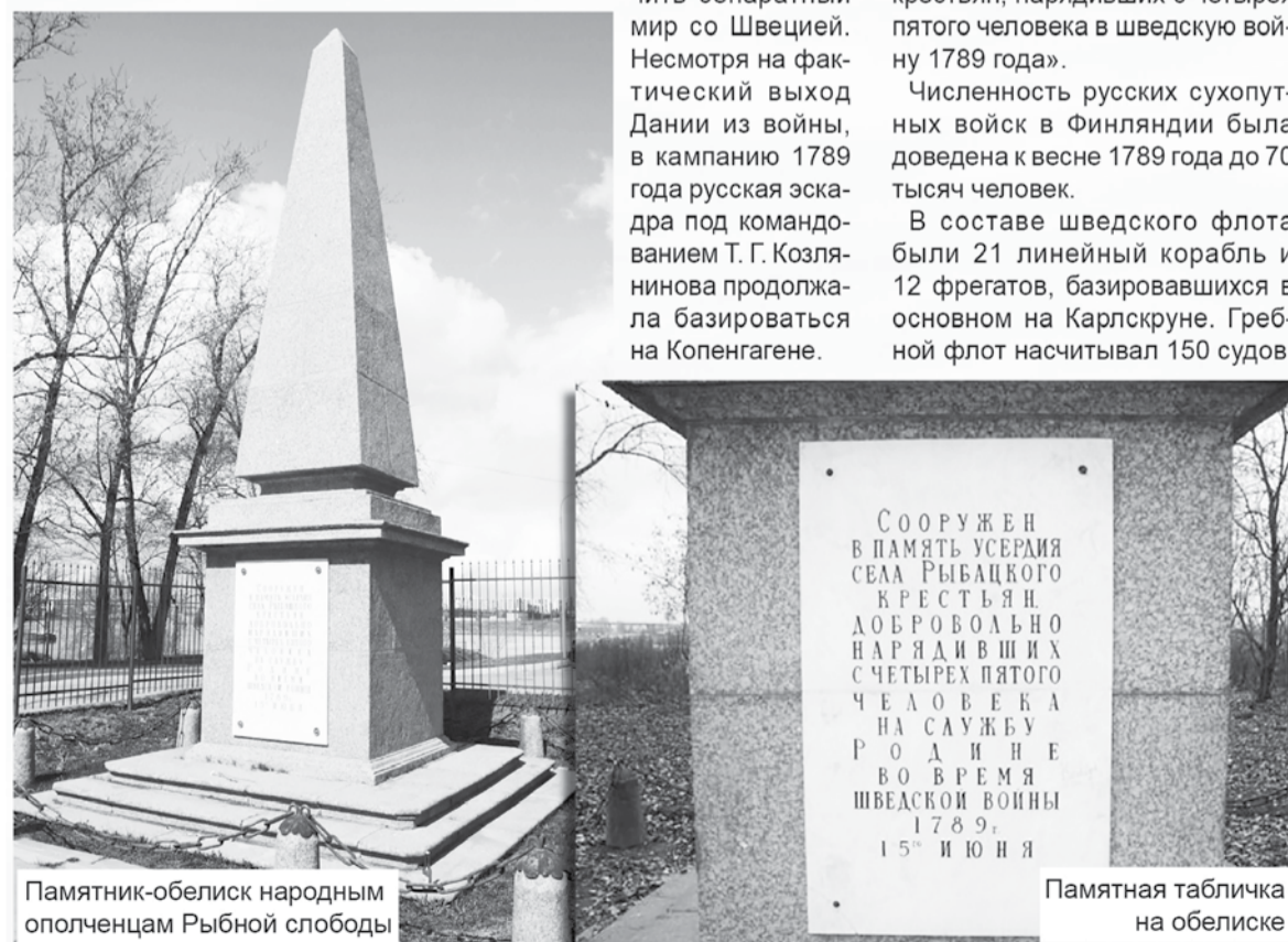
Памятник-obelisk народным ополченцам Рыбной слободы