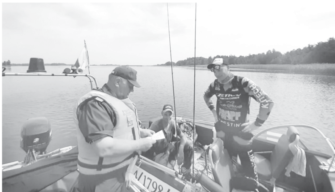
Во время рейдов инспекторам регулярно встречаются и законопослушные судоводители

Кстати, совместные рейды с полицейскими обусловлены