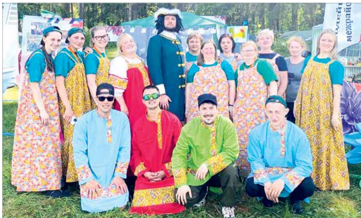
Приветствие – с родины Балтийского флота