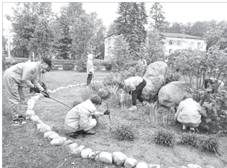
Ребята из ГМТО «Перспектива» благоустроили клумбу в центре города

– В этом направлении у нас организовано сотрудничество. Этим летом в Центре социальной защиты населения «Возрождение» на отделении детей-инвалидов и детей с ограниченными возможностями здоровья пройдут реабилитацию 28 человек, на отделении стационарной и полустационарной форм социального обслуживания – 24 ребёнка.