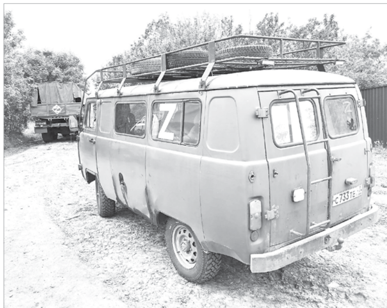
УАЗ «буханка» уже работает на фронте

Вторая машина везла груз для нескольких воинских частей и подразделений, где проходят службу наши земляки, – оцинкованную сетку-рабицу, три генератора, стройматериалы, колеса и автомобильную резину разного диаметра, автозапчасти и аккумуляторы на военную спецтехнику, канистры под воду и продукты. Также бойцам была передана дорогостоящая спецтехника. Два тепловизора и два