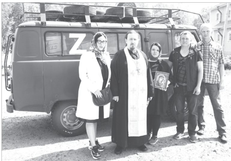
У храма перед отъездом

солдат и отдельной гуманитарной помощью. Волонтёры за несколько недель силами неравнодушных жителей Подporожского и Лодейнопольского районов смогли закупить для наших защитников одежду и обувь, маскировочные сети, средства гигиены и медицинские препараты.