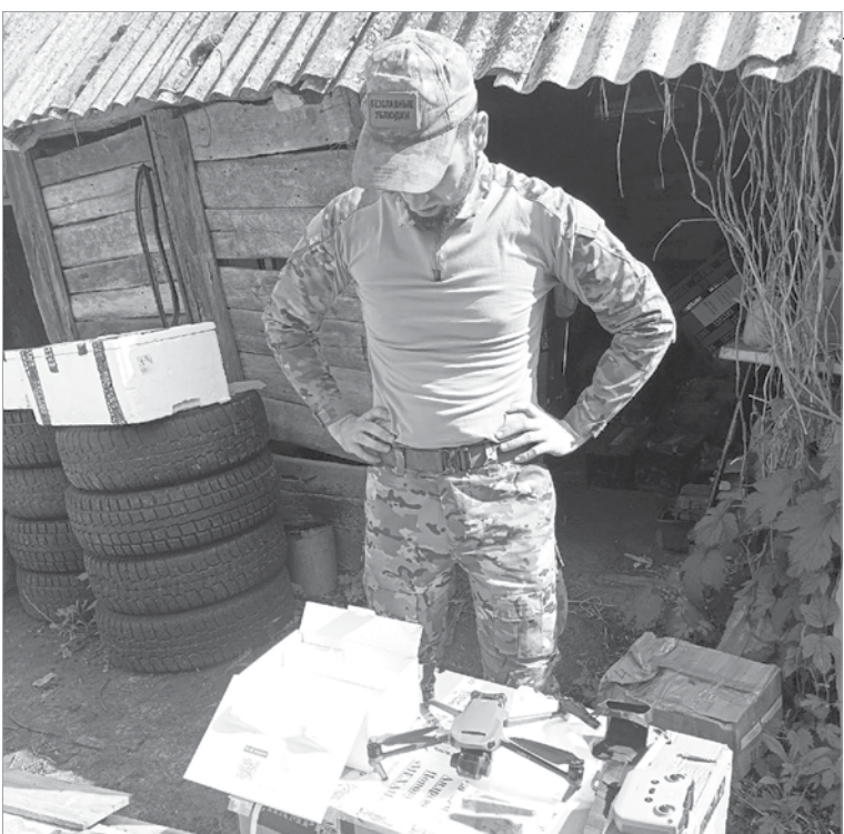
Генератор и квадрокоптер для бригады «Шторм»