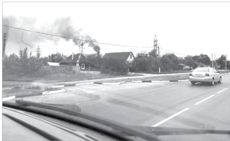
На въезде в Шебекино

миссию, даже поблагодарили за помощь фронту. Тут подоспели и наши бойцы. Быстро перегрузились, обнялись, обменялись парой фраз и умчались выполнять боевые задачи».