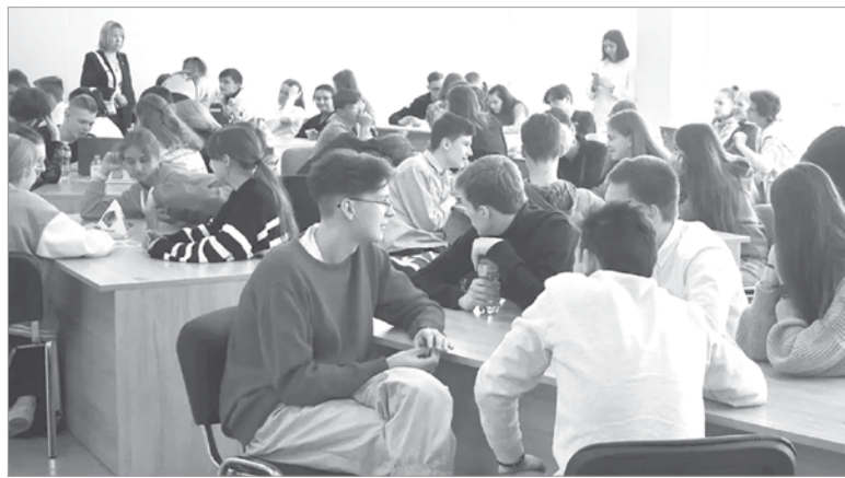
В региональном этапе соревновались 15 команд