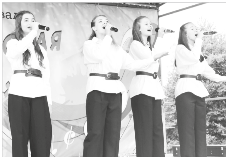
В Год семьи фестиваль открыл «Гимн о семье»