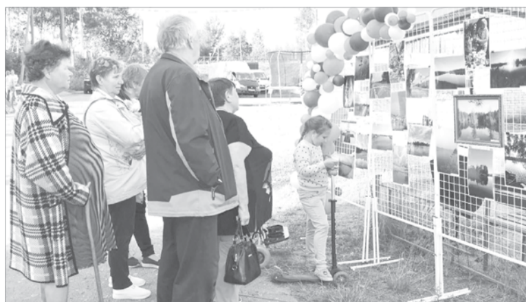
Работы на фотоконкурс «Доможировское поселение в кадре»