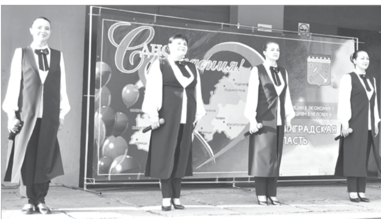
Выступает вокальный ансамбль «Мелодия»