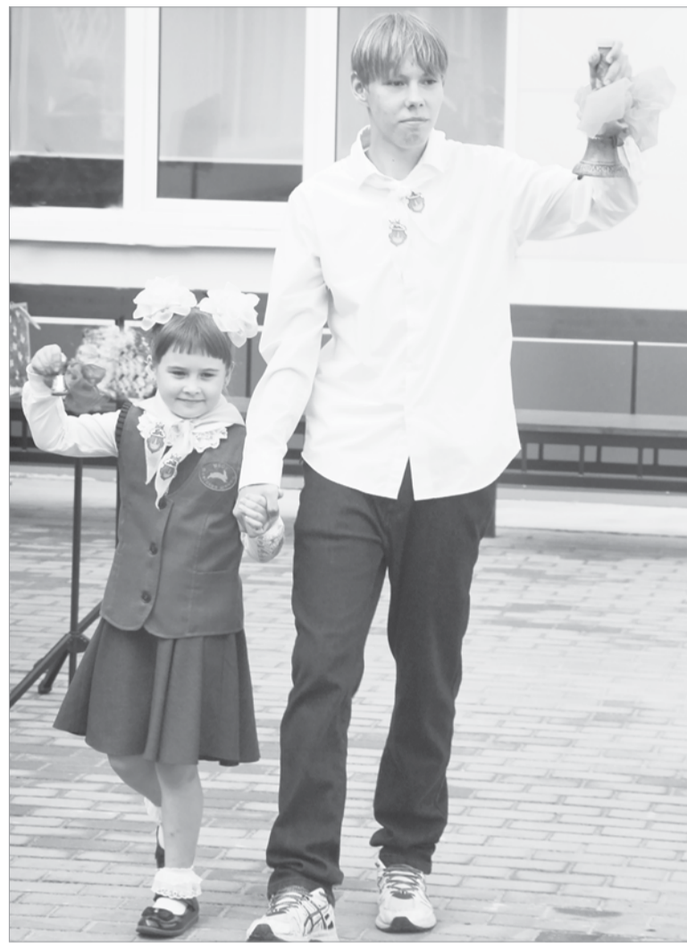
Звонок на первый урок