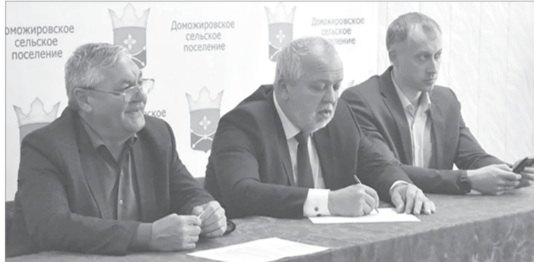
Вопросы жителей представители власти взяли на контроль