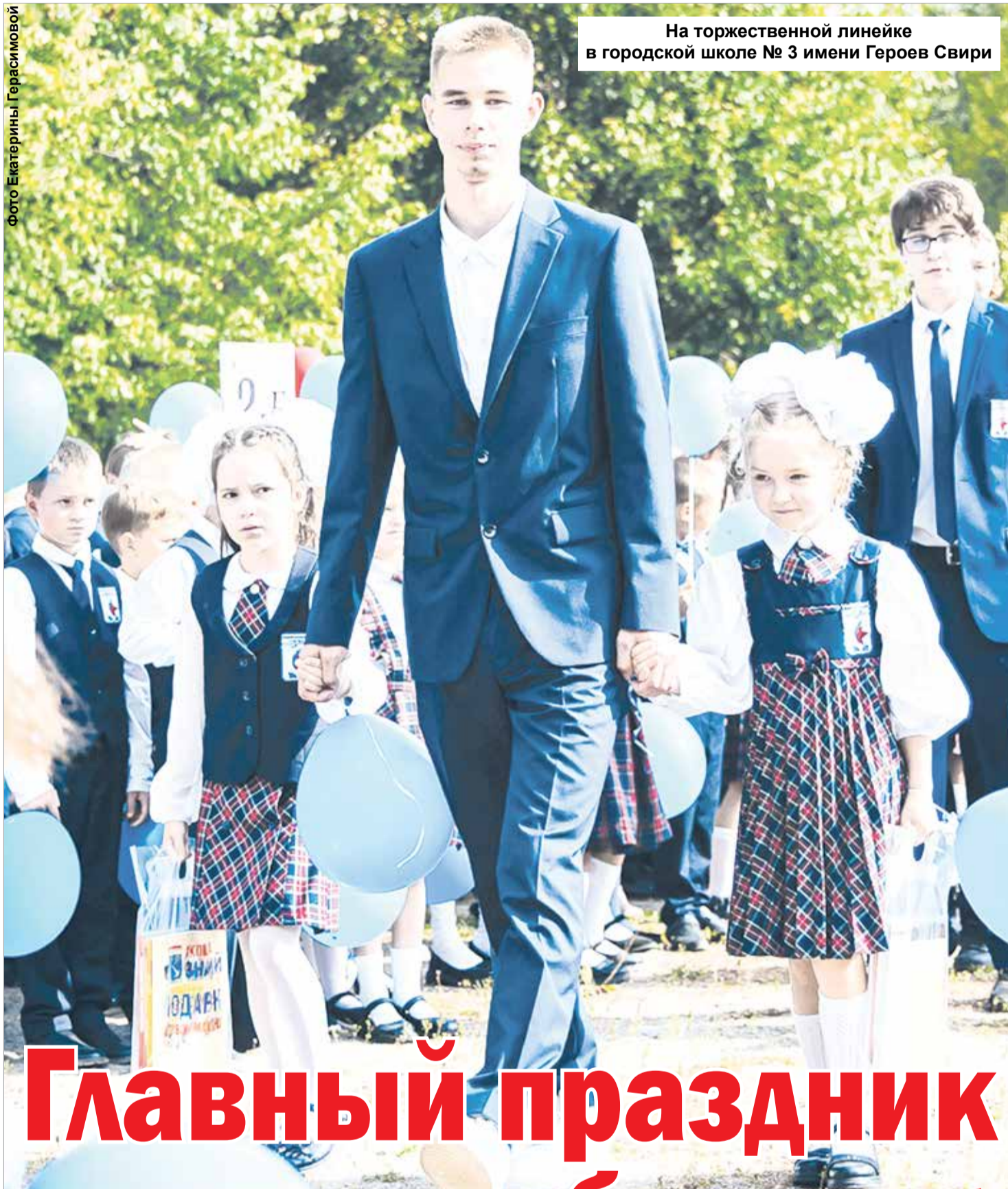
На торжественной линейке в городской школе № 3 имени Героев Свири