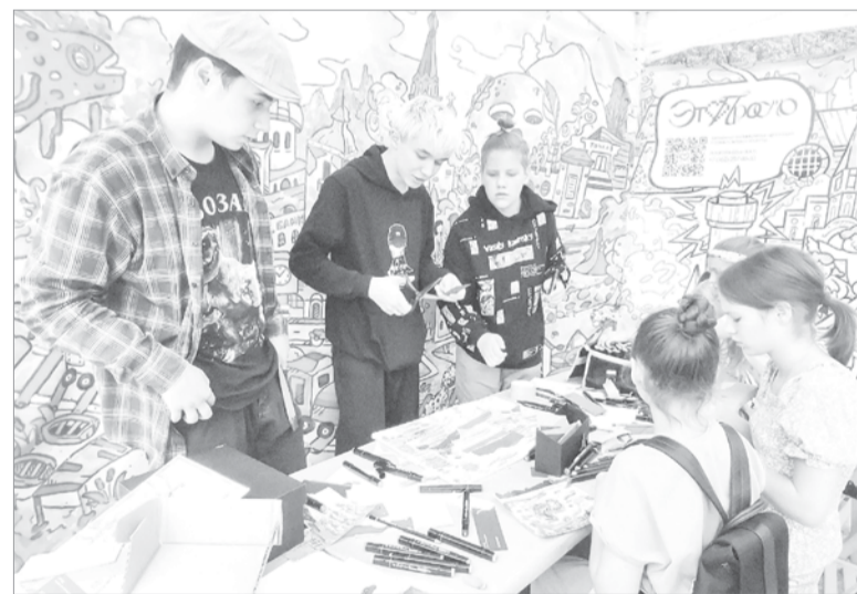
Участники молодежного проекта «Это просто»

Новичками грантовой программы стали юные журналисты из Мурино. Их проект – «Детское телевидение Ленинградской области» – помо-