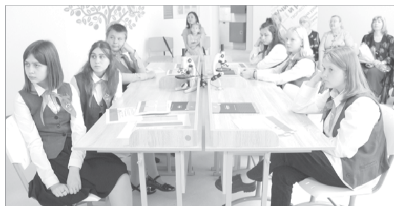
Открытие «Точки роста» – новый этап в развитии школы