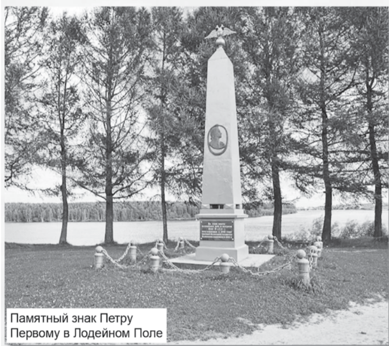
Памятный знак Петру Первому в Лодейном Поле

деревне Мокришвице, расположенной на левом берегу Свири. Тогда там существовала пристань, называемая Лодейной, которая служила своеобразным торговым пунктом и причалом для кораблей. Осмотрев здешние места, Пётр отметил обилие качественного соснового леса и плодородные земли, богатые торфом, глиной и известняком. Лодейная пристань располагалась близко к Олонецким металлургическим заводам, где отливались корабельные пушки, и имела удобный выход