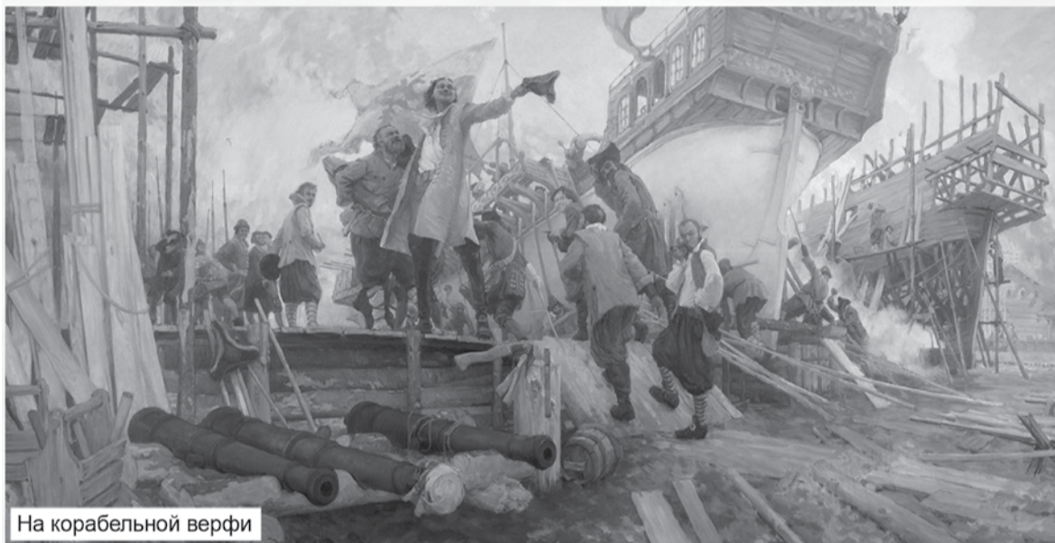
На корабельной верфи

Среди мобилизованных были временные и постоянные. К постоянным относились записные и незаписные. Записных набирали с помощью рекрутского набора, сбора с приписных местностей и губерний по числу дворов.