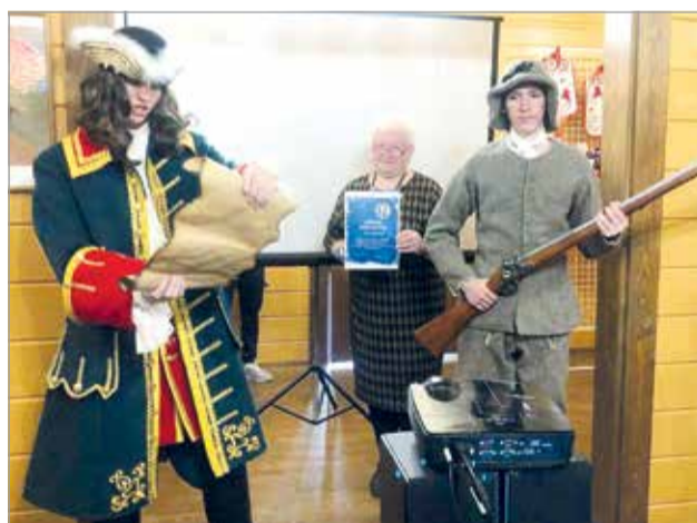
На церемонии награждения подвели итоги и назвали победителей