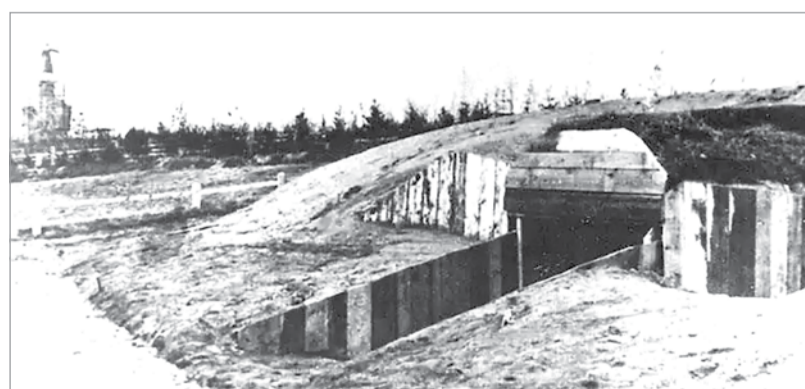
Сооружения в парке возводили бойцы Карельского фронта