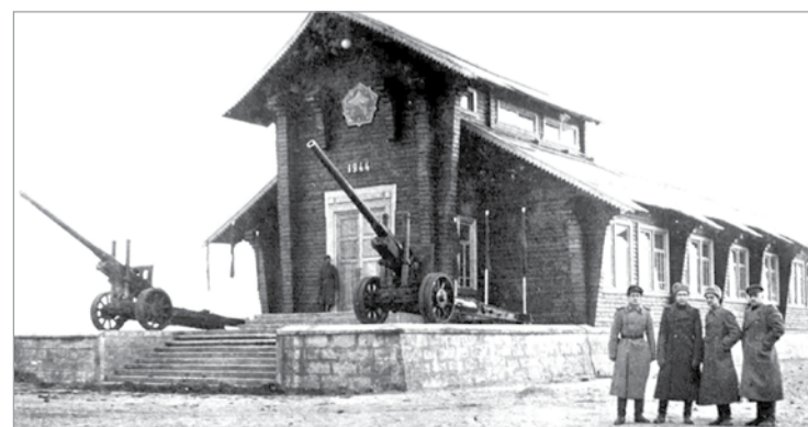
Здание музея «Свирская Победа» (1944 год)