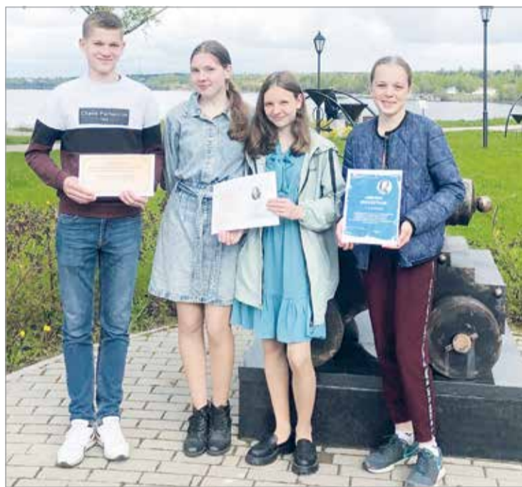
Команда «Поколение» заняла 1-е место