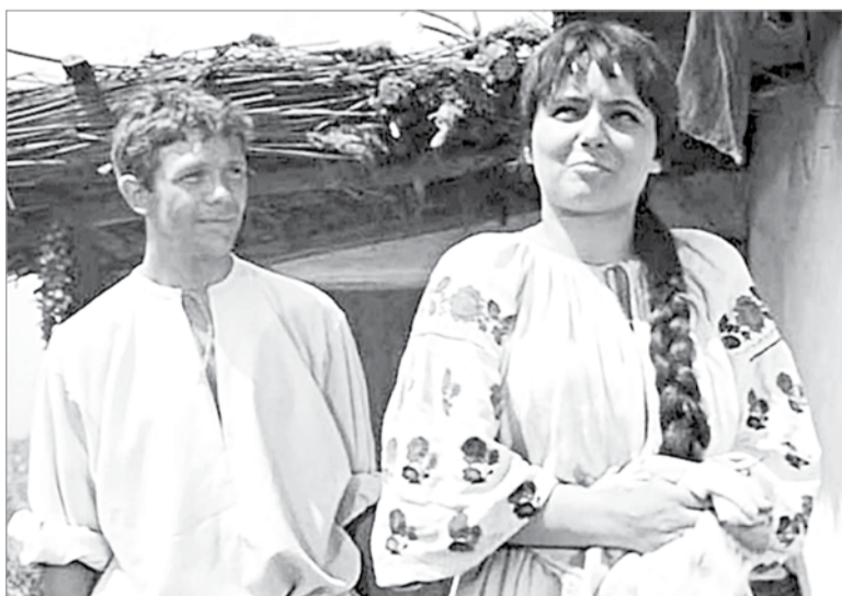
Кадр из фильма «Свадьба в Малиновке»

– Сын родился в Петрозаводске. Я после окончания института махнул работать в театр в столицу Карелии. И почти сразу меня пригласили в Пушкинский театр в Ленинграде. Раз уехал, у меня в Карелии тогда даже отобрали паспорт, ведь положено было два года отработать. Вообще многое связано с Петрозаводском. Жена тогда постоянно болела, маленький сын был полностью на мне. Жили мы возле театра, и я придумывал разные приспособления, чтобы быстрее его распеленать, «изобрел» качалку с двигателем, чтобы сын спал, пока я на репетиции. Хорошее телевидение тогда было в Карелии.