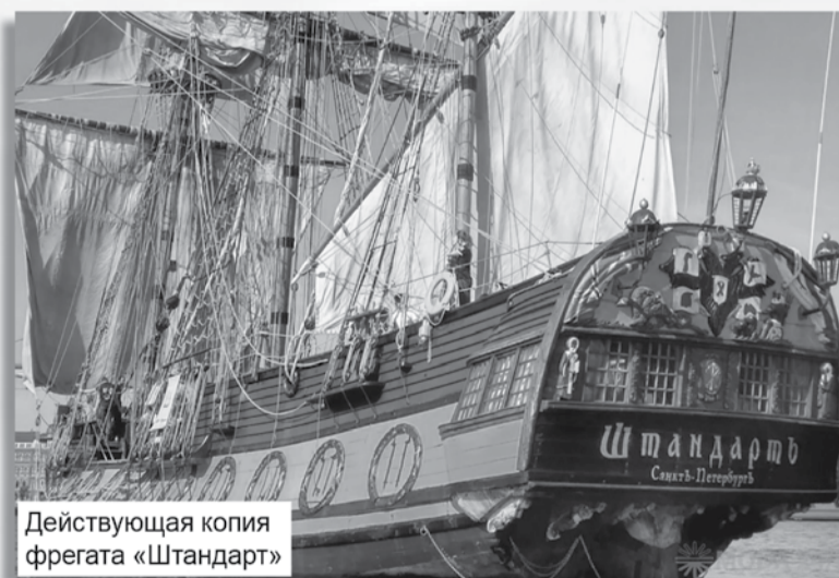
Действующая копия фрегата «Штандарт»

Люди, жившие в этих местах, издавна занимались постройкой различных плавсредств и промышляли лесозаготовкой. Лесами в округе было покрыто примерно три четверти всей площади. Местные мастера имели многолетний опыт строительства как «легкокрылых» судов, так и тяжёлых прочных судов, приспособленных для ледовых условий. Поэтому, когда свирским корабе-