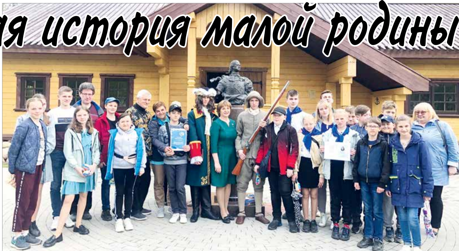
Участники и организаторы квеста у музея-павильона «Домик Петра I»