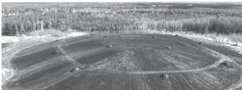
В марте 2022 г. завершена рекультивация 40-летней свалки под Сосновым Бором

За прошедший год в регионе ликвидировано более двух тысяч лесных и дорожных свалок, закрыты два полигона, ликвидирована свалка в Сосновом Бору. Со временем все старые свалки и полигоны смешанных отходов должны быть рекультивированы.