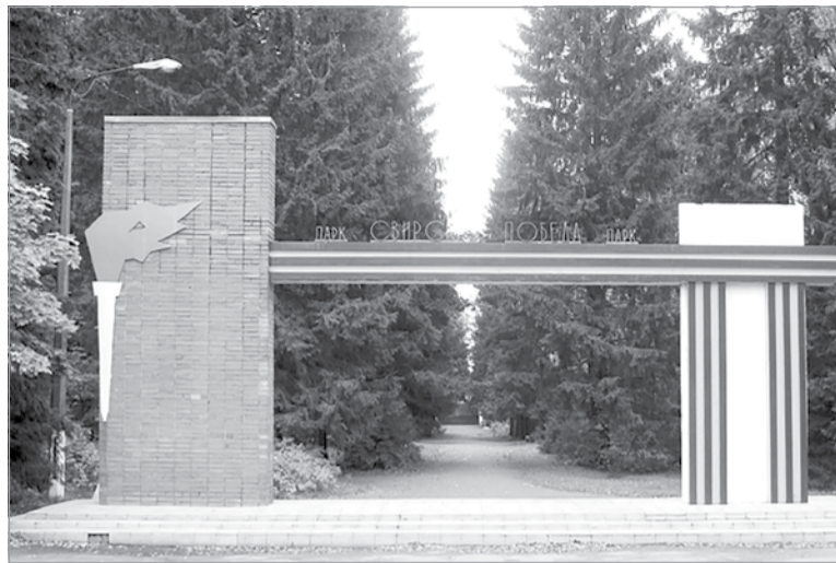
Центральный вход в парк

Для реализации замысла по созданию мемориального комплекса Военным Советом Карельского фронта была организована проект-