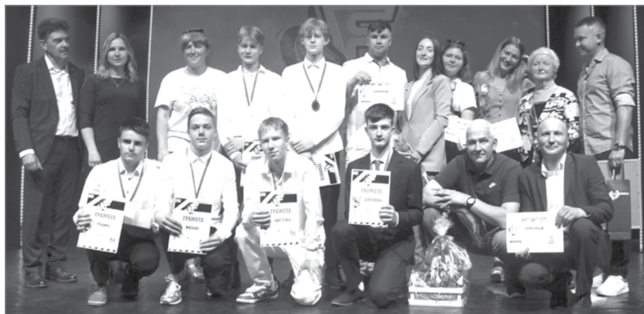
Выпускники клуба 2023 года