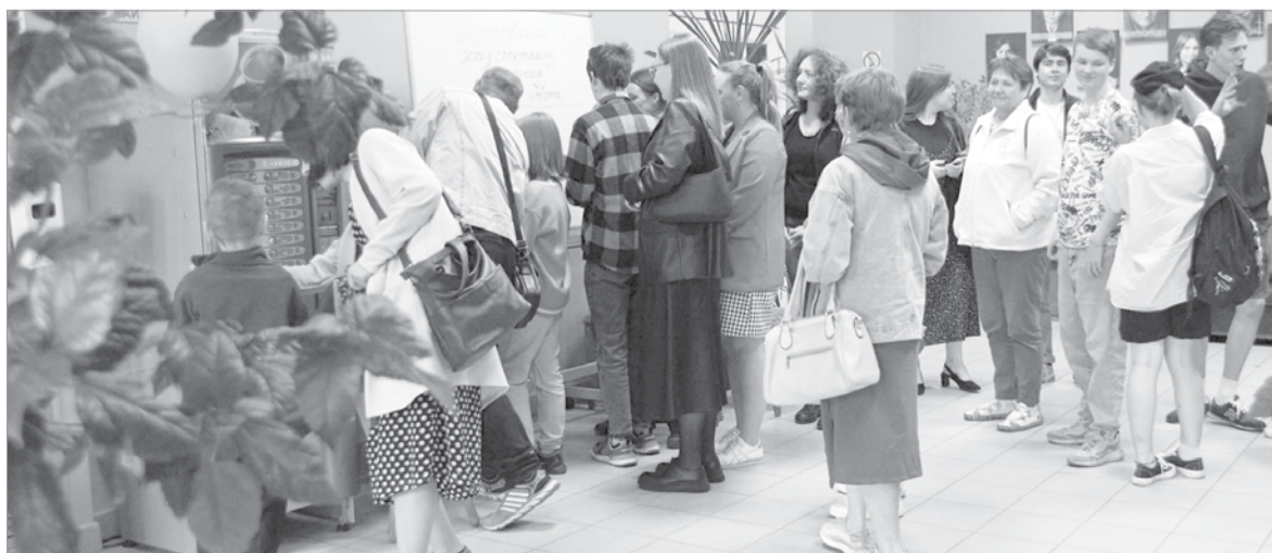
Идёт зрительское голосование

Огромное спасибо режиссёрам, актёрам, художникам, специалистам театра за слаженную, профессиональную работу, а зрителям – за любовь и преданность театру, за тёплые и бурные аплодисменты!