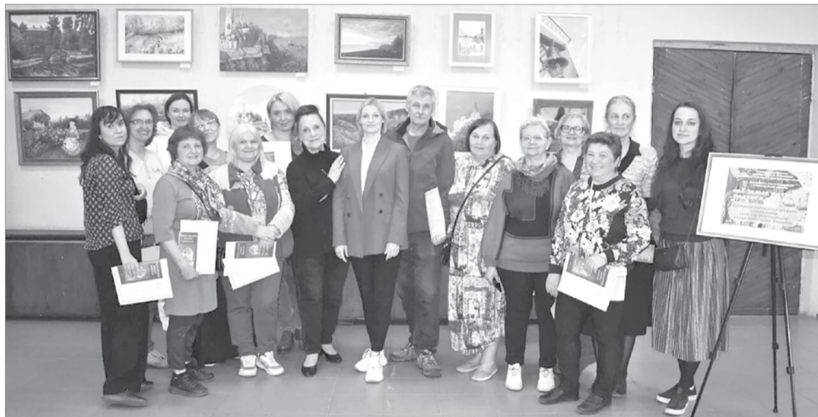
Художники из Северной столицы на презентации выставки

В рамках экскурсии гости узнали об истории монастыря, посетили церковь Введения во храм Пресвятой Богородицы и часовню преподобных Сергия и Варвары Островских – родителей святого Александра Свирского. Они познакомились с уникальной выставкой, посвящённой жизни и творчеству последнего епархиального архитек-