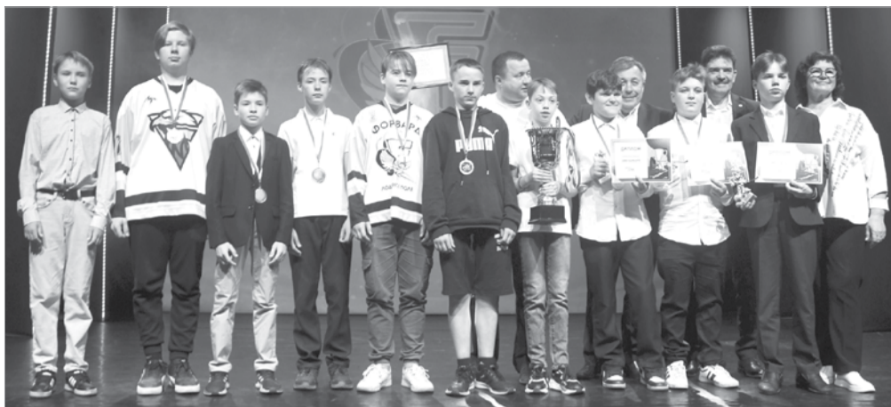
Команда «Форвард» – победитель Первенства Ленобласти по хоккею