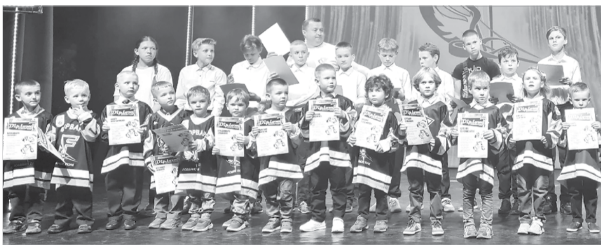
Новички дали «Клятву юного хоккеиста»