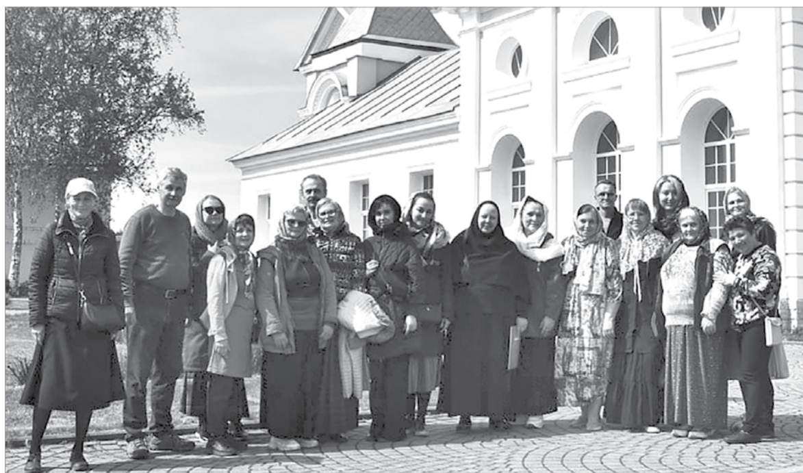
В обители для гостей организовали экскурсию

тора Санкт-Петербургской губернии Андрея Петровича Аплаксина, который внёс неоценимый вклад в строительство, сохранение и реставрацию храмов Санкт-Петербурга и Ленинградской области. Администрация и коллектив МКУ «Оятский культурно-спортивный центр» выражают огромную благо-