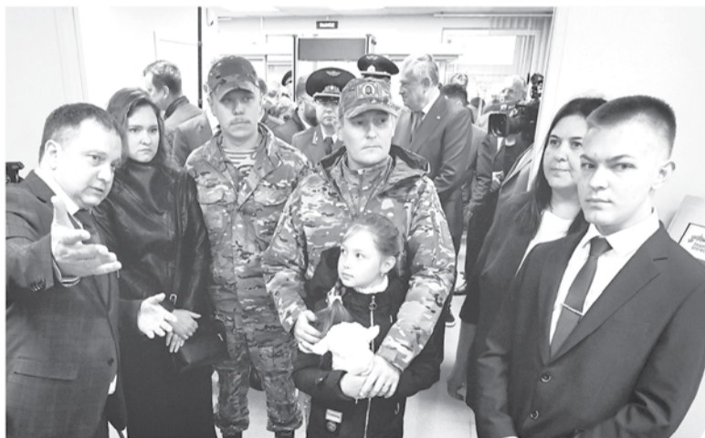
В центрах филиала ждут как военнослужащих, так и членов их семей

альной военной операции в нашем регионе. Ранее такой центр начал функционировать на базе всеволожского Мультицентра социальной и трудовой интеграции. Ещё один до конца июня планируется открыть в Гатчине на базе «Государственного института экономики, финансов, права и технологий». Сейчас рассматривается возможность открытия филиалов в Луге и Тихвине.