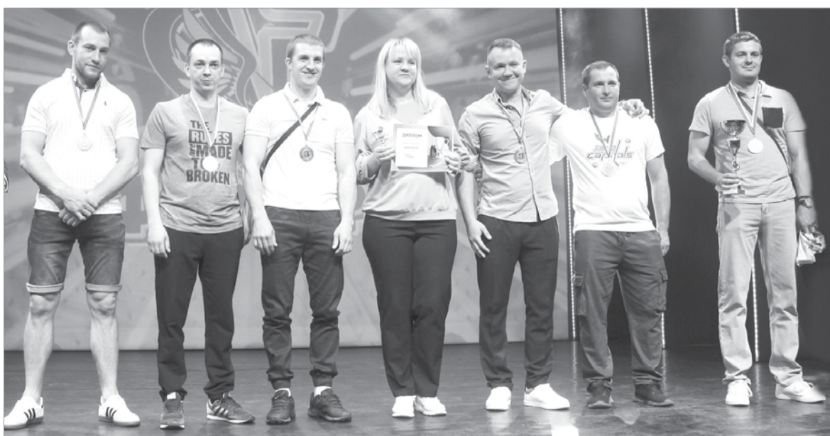
Награды вручили мужской команде «Форвард»