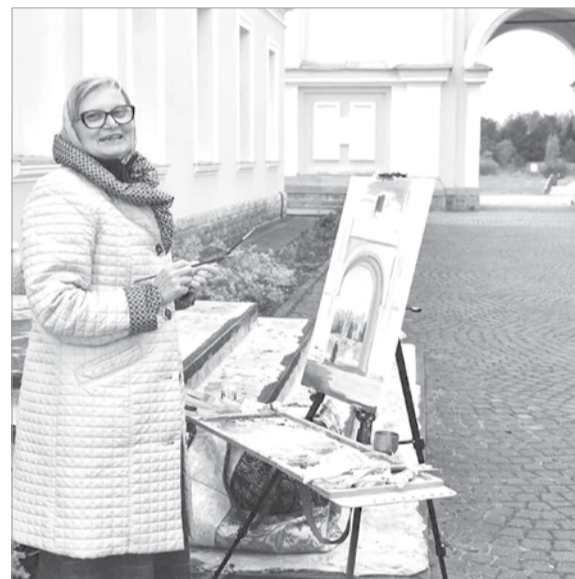
Пленэр на территории Введено-Оятского монастыря