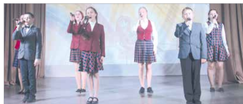
Творческий подарок – от юного поколения