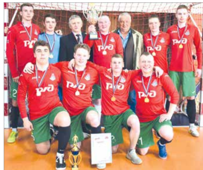
Победитель турнира – команда из Кеми