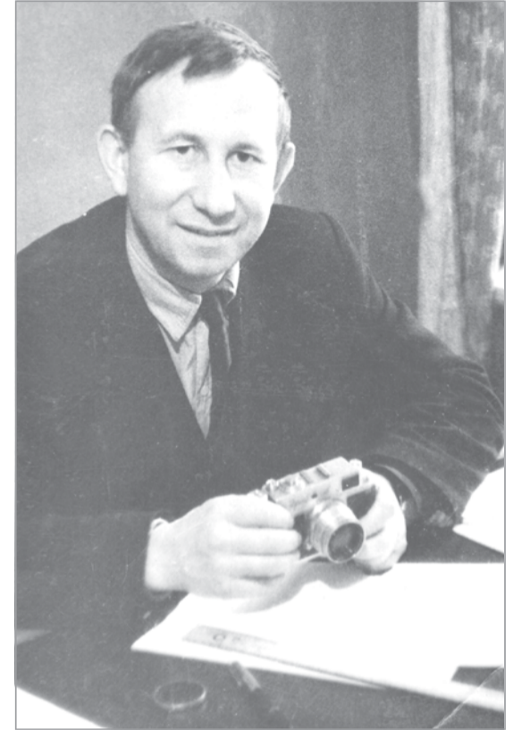
Много лет не расставался с фотоаппаратом

Писал он свои утренние строки, обдумывая их и переделывая, а порой и рвал уже исписанные листы. С утра старался самым первым из авторов принести секретарю-машинистке новый репортаж или подборку новостей. И потом с удовлетворением поглядывал на висевший в кабинете ответственного секретаря график редакционного состязания, в котором он всегда был лидером по количеству сданных газетных строк. Нетерпеливо ждал от коллеги одобрения, чтобы ринуться на новое задание. А когда видел, что его материал нещадно сократили, чтобы вместить все заметки с фотографиями на одну полосу, порой не выдерживал... Мог ругнуться, бросить на стол ответственного секретаря или редактора что-нибудь из того, что попало под руку. По редакции нашей районки