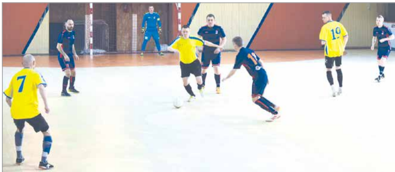
Турнир открыли футболисты Лодейного Поля и Петрозаводска

Валентина ПОЛЯНСКАЯ