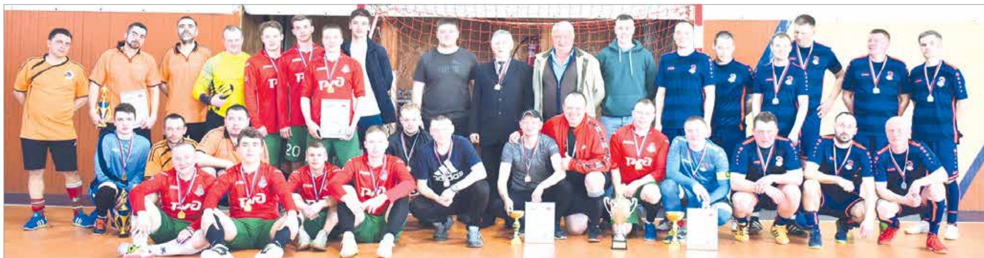
Команды, участвующие в турнире железнодорожников, объединены общей любовью к футболу