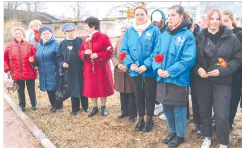
Торжественное открытие памятного знака на аллее Славы

26 апреля на аллее Славы у братского кладбища состоялось торжественное открытие памятного знака лодейнополцам – участникам ликвидации последствий катастрофы на Чернобыльской атомной электростанции.