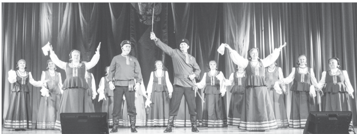
Хоровая группа ансамбля «Северные узоры»