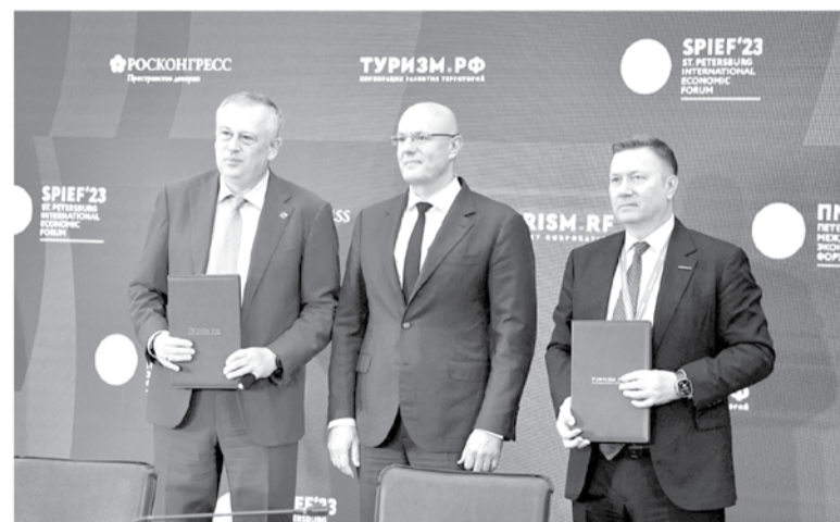
Вице-премьер Дмитрий Чернышенко (в центре) отметил развитие туристической отрасли региона

Что касается импортозамещения, то здесь тоже есть свои успехи. Компания «Глория» инвестирует 4 млрд рублей в производство дефицитных упаковок для лекарств, а предприятие «ФАВА» вдвое увеличит выпуск кормов для домашних животных.