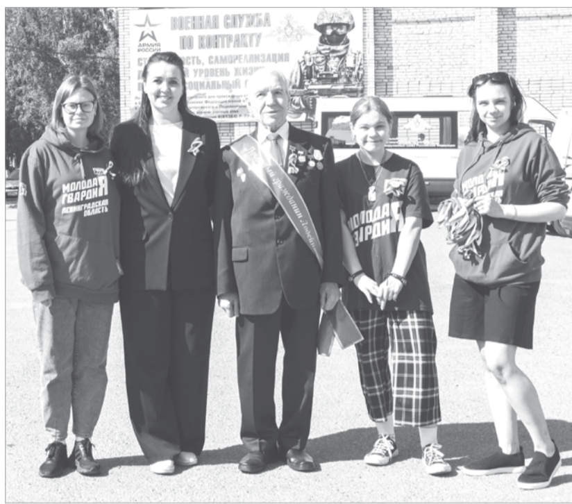
Вместе – ветераны и молодёжь