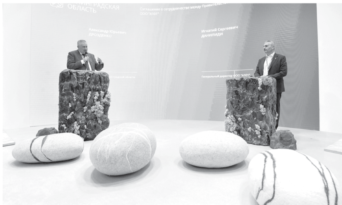
Стенд Ленинградской области был украшен древесиной, живым мхом и гигантскими валунами

Стенд Ленинградской области на ПМЭФ-2023 традиционно выделялся на фоне других регионов. Вокруг царила промышленная эстетика: внимание публики притягивали макеты заводов и прототипы автомобилей будущего, на больших экранах строились заумные графики и диаграммы. Команда 47 выбрала другой стиль — Ленобласть презентовала миру свои природные богатства. Стенд встречал гостей карельскими валунами, на мультимедийных панелях сменялись виды красот ленинградской земли, даже зону переговоров украсили живым мхом и древесиной. Вместо пафоса и урбанизма людям предложили комфорт и силу природы.