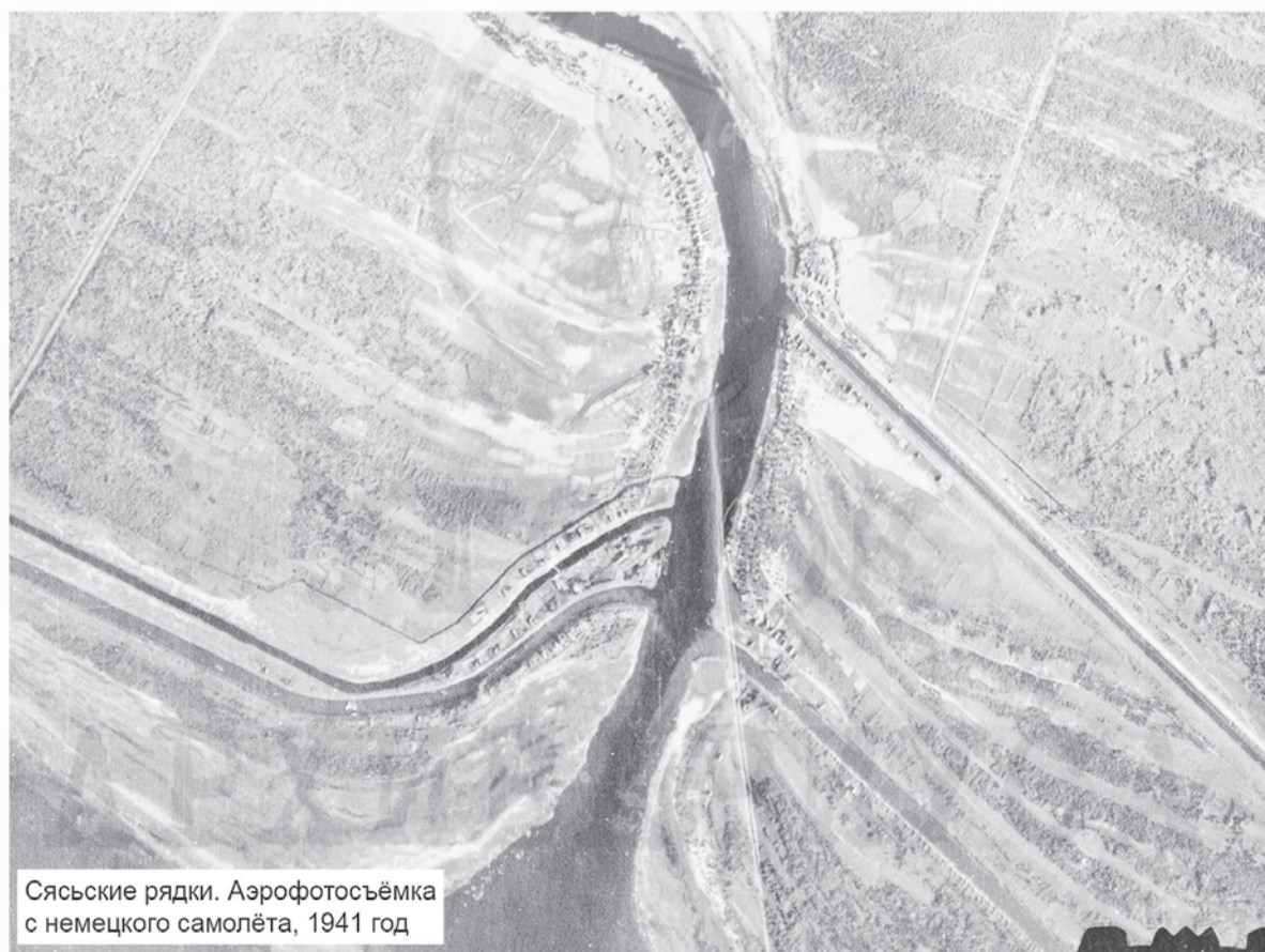
Сясьские ряды. Аэрофотосъёмка с немецкого самолёта, 1941 год