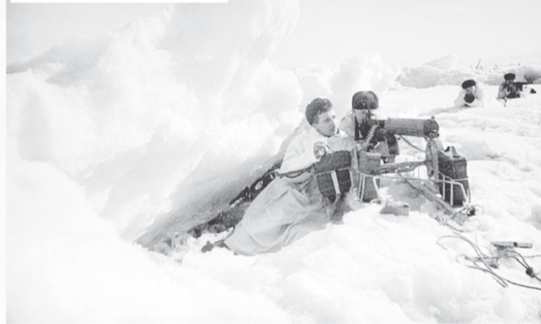
Красноармейцы на льду Финского залива, 1942 год

ли одна за другой, пока, наконец, не поняли, что противолодочный рубеж не преодолеть, и походы подводных лодок прекратились до осени 1944 года. Выход в Балтийское море советскому флоту был закрыт окончательно.