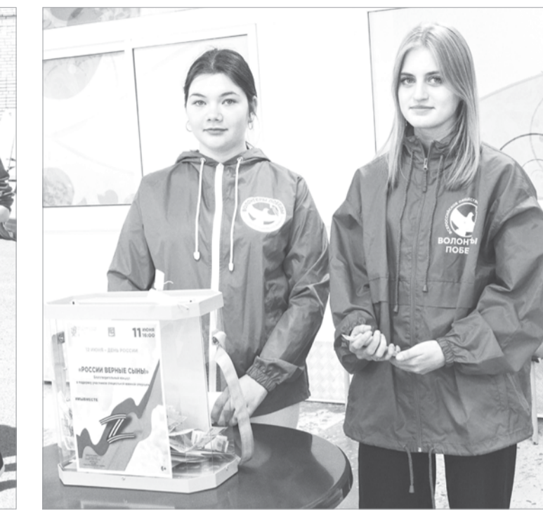
Сбор средств в поддержку участников СВО

«Всё для фронта! Всё для Победы!», «Наша сила – в единстве! Победа будет за нами!» – именно эти призывы объединили жителей нашей