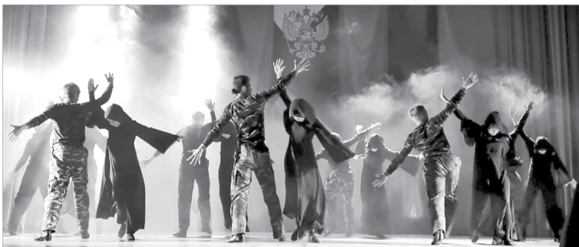
Защитникам Отечества посвящается (танцевальная группа ансамбля «Северные узоры»)

Светлана МИХАЙЛОВА, Лариса НИКОЛАЕВА