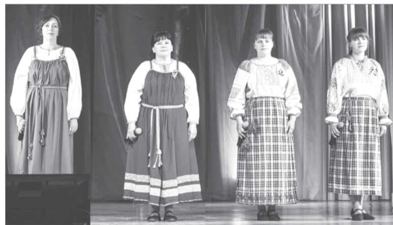
Вокальный коллектив «Лада» из Алёховщины