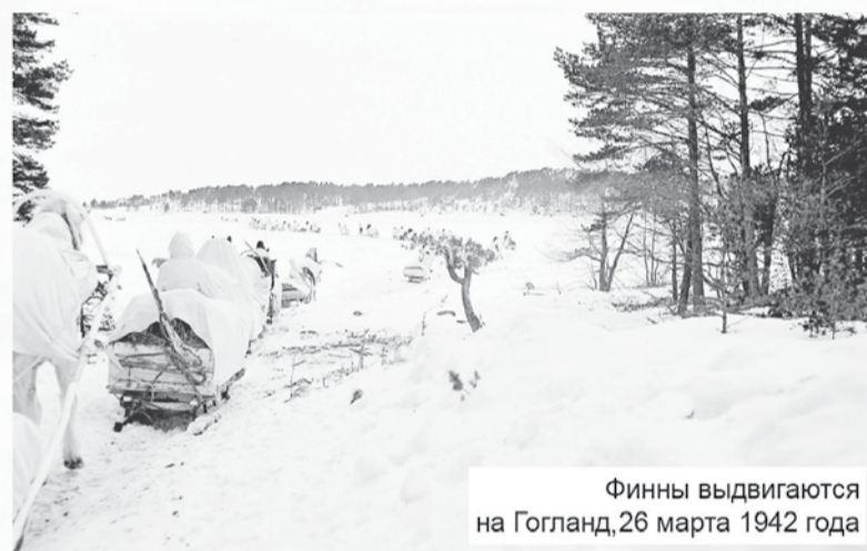
Финны выдвигаются на Гогланд, 26 марта 1942 года

Заняв Гогланд, отряд полковника Барина оказался в сложном положении: финны в течение одной ночи могли получить подкрепление и атаковать остров. Отряд Барина (161 человек)