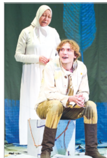
Спектакль «Синюшкин колодец»