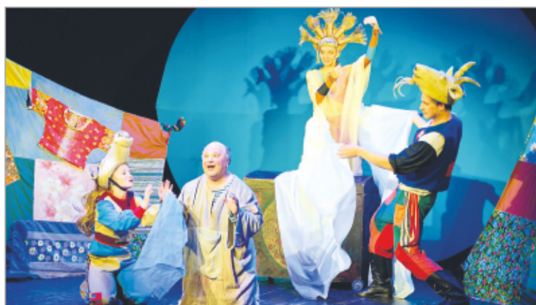
Детский спектакль «Сказки Пушкина»