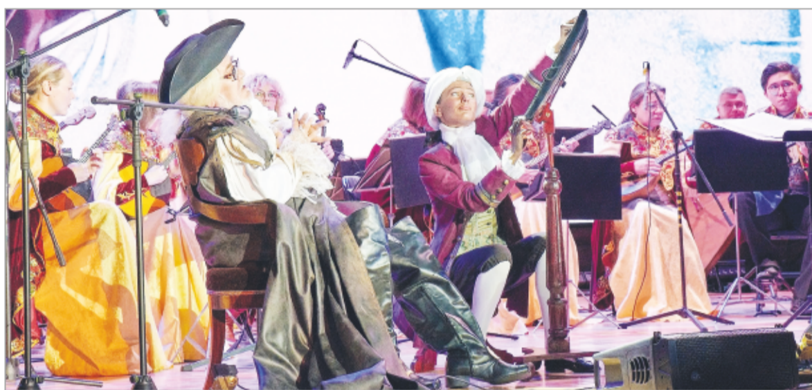
Фестиваль открыл проект «Медный всадник» театра «Святая крепость» и оркестра «Метелица»

Галина ХАРИЧЕВА