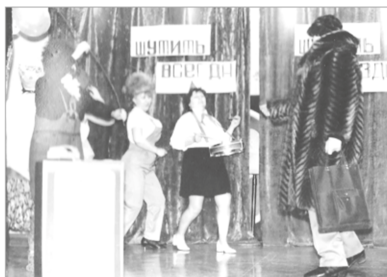
Концерт художественной самодеятельности в Янегском клубе (1980-е годы)

Решением Леноблисполкома от 17.09.1973 года административный центр Первомайского сельсовета из д. Тененичи перенесён в посёлок Янега.