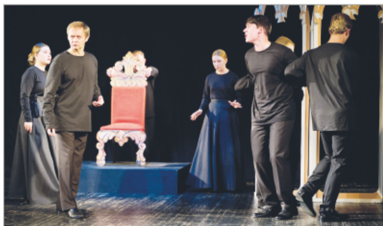
Момент премьерного спектакля «Анджело» театра «Апрель»