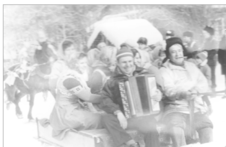
В посёлке – праздник проводов зимы (1970-е годы)