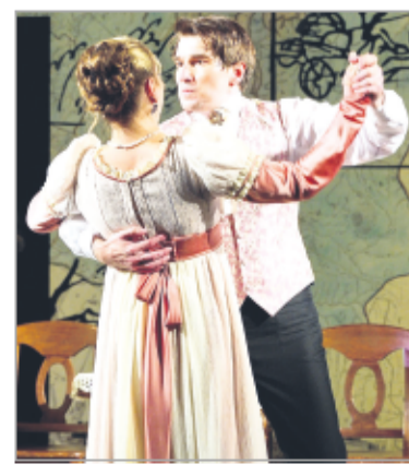
«Дорожные истории» театра «На Литейном»