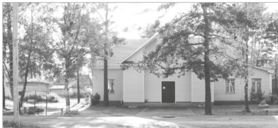
Здание Дома культуры (2011 год)

Много на свете красивых и живописных мест, но есть на Лодейнопольской земле один уголок, невероятно притягательный моему сердцу. На этом месте, а точнее в 60-е годы прошлого века, был густой лес. И вот в 1954 году здесь застучали топоры, зазвенели пилы – началось строительство нового посёлка. И в эти осенние дни жители Янеги отмечают 70-летие своей малой родины.